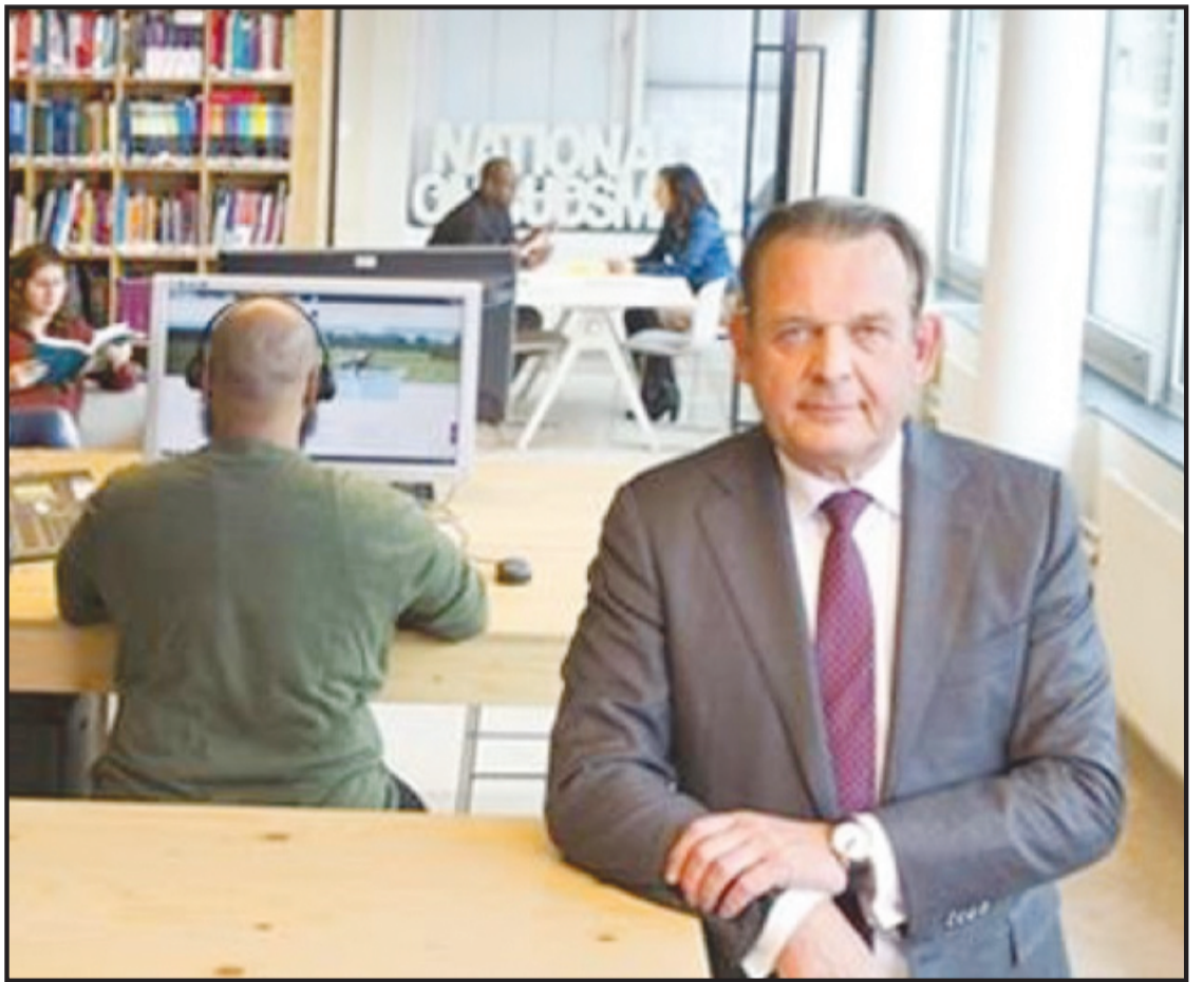
Interesante programa ‘Aki Boneiru’ awe

Na momentu ku el a bira un tiki moli mi a kòrt’é i a ripará ku e ta putrí paden. Mi no ta kere ku e estableimentu na unda mi a kumpra e fruta aki tin falta.”